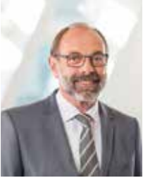
Ulrich Klaus Becker ADAC Vizepräsident für Verkehr

Mobilität ist Grundlage für ein selbstbestimmtes Leben.